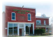
Centre culturel de Weedon